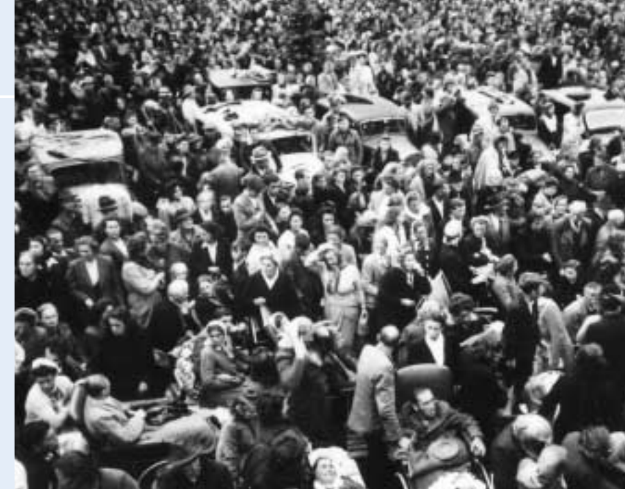
Menschenmenge am Traberhof bei Rosenheim September 1949 während eines Vortrags Bruno Grönings

Ein besonderer Hinweis für das Wirken einer Heilkraft ist das Auftreten von Heilungen an Tieren. Hier gibt es eine Gruppe von Tierärzten in der MWF, die derartige Berichte prüfen. Auch Heilungen ohne Wissen des Geheilten, so genannte Fernheilungen lassen sich nicht mit den Begriffen der Suggestion erklären. Bruno Gröning betonte immer wieder, dass die Heilungen durch die Aufnahme des Heilstroms keine Wunder seien. Er wehrte sich, das Wirken dieser Kraft zu mystifizieren oder als übernatürlich darzustellen: »Meine Heilungen beruhen auf einer innerhalb der göttlichen Ordnung, der Natur liegenden Kraft und nicht auf