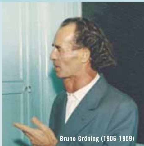
Bruno Gröning (1906-1959)