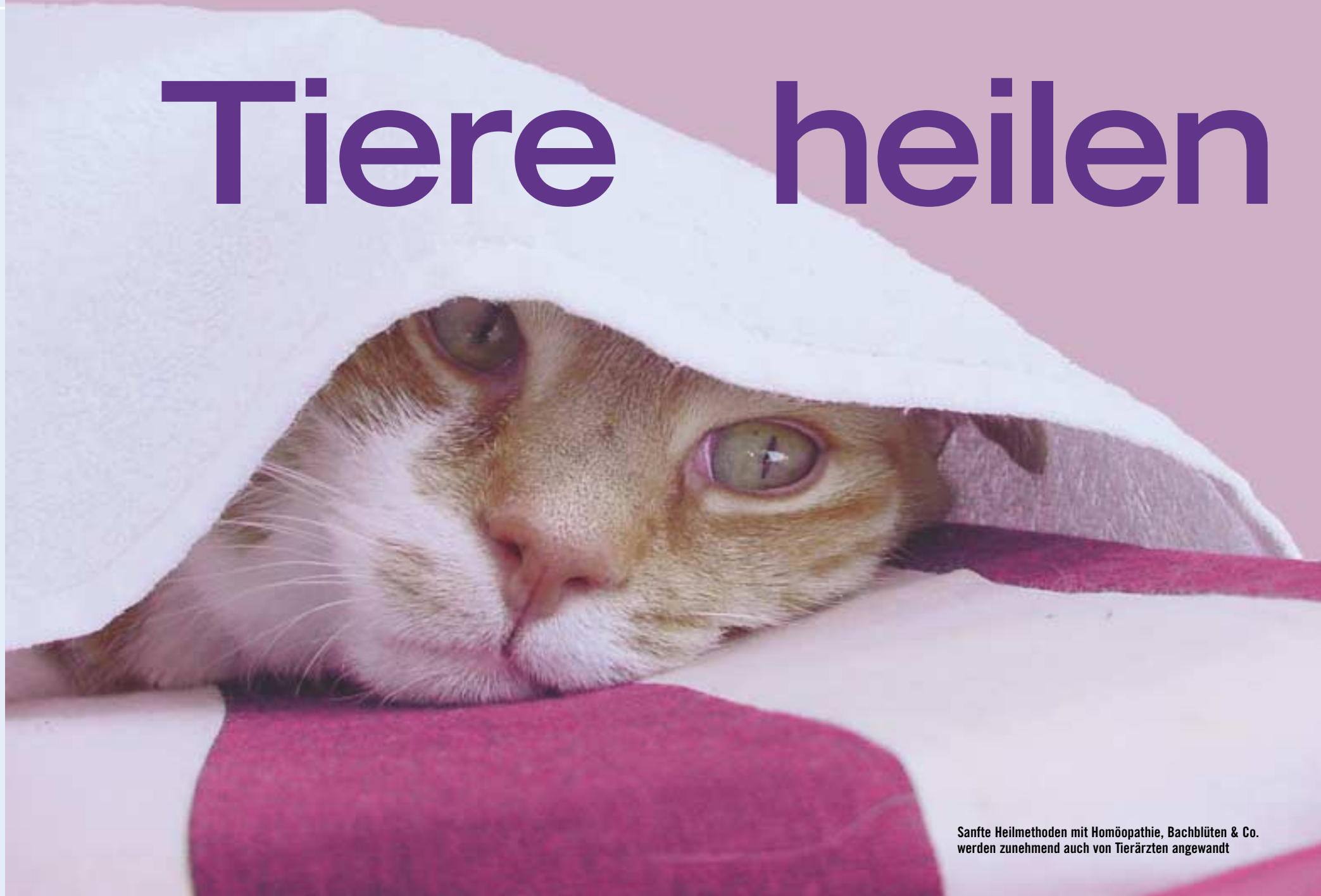
Sanfte Heilmethoden mit Homöopathie, Bachblüten & Co. werden zunehmend auch von Tierärzten angewandt

Krankheiten und Verhaltensauffälligkeiten bei Hund, Katze, Pferd und anderen Tieren können genauso wie beim Menschen durch falsche Ernährung, Kummer, Stress oder Dissonanzen im Energiefeld entstehen