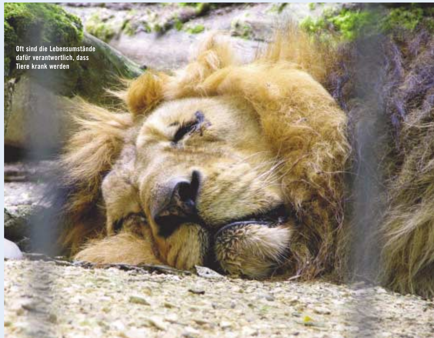
Oft sind die Lebensumstände dafür verantwortlich, dass Tiere krank werden

Kühe geben mehr Milch, wenn der Stall mit leiser Mozart-Musik beschallt wird oder lassen sich williger besamen, wenn der Tierarzt einen rosa Overall trägt... Jede Zelle des Tieres nimmt Licht, Farbe und Töne auf und überträgt die Schwingungen in tiefer liegende Gewebe, Organe und nicht zuletzt in die Seele. In der Farbtherapie kommen hauptsächlich die sieben Regenbogenfarben zur Anwendung. Die Beispiele für Indikationen sind vielfältig: ob Gelenke, Muskeln, Entzündungen, Atemwegserkrankungen oder Verhaltensprobleme... ein Versuch mit Farben oder Tönen lohnt sich