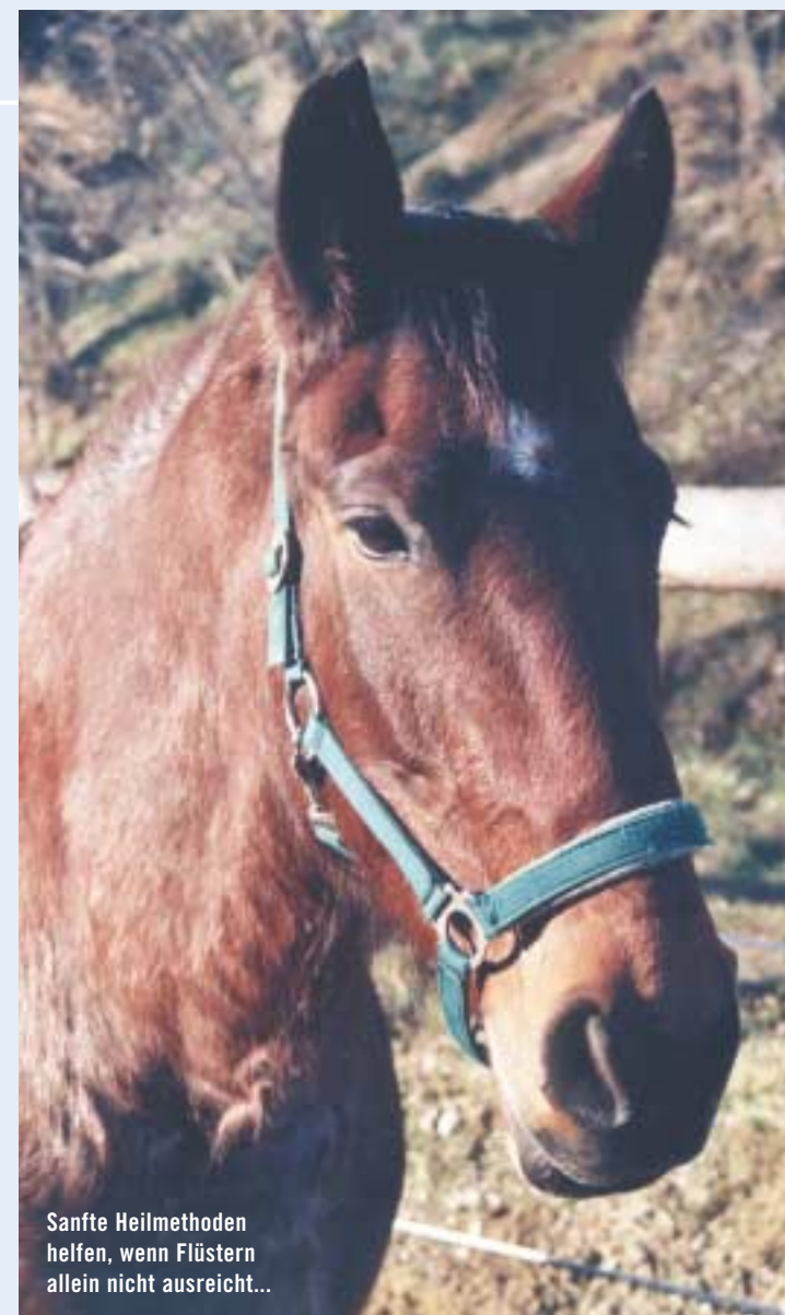
Sanfte Heilmethoden helfen, wenn Flüstern allein nicht ausreicht...

immer. Die körpereigenen Regenerations- und Heilungsprozesse werden angeregt, Mensch und Tier kommen wieder in die Mitte. Die passende Farbe kann mit dem kinesiologischen Muskeltest oder einem anderen bioenergetischen Testverfahren gefunden werden.